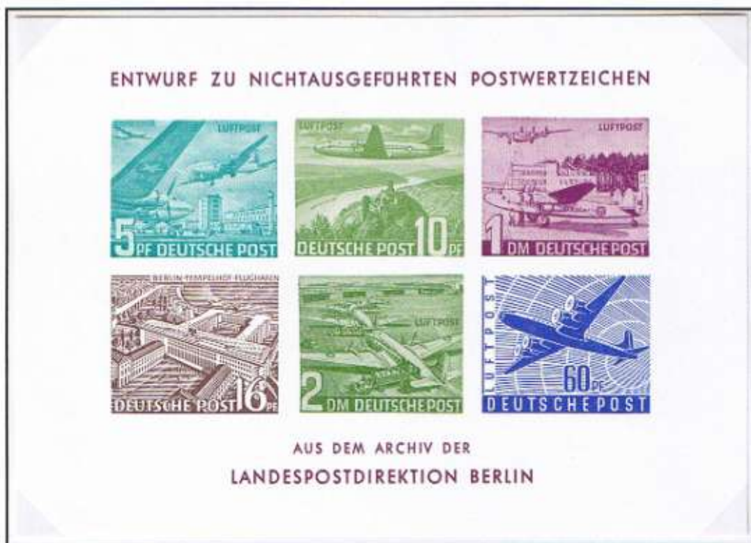
Das Motiv Flughafen-Tempelhof durchlief mehrere Entwurfsphasen (verschiedene Farben, Markengrößen und Wertstufen). Die notwendig werdende Anpassung der Gebühren an die Westdeutschlands zum 01.06./07.07.1949 war ein Grund. Der Entwurfblock zu einer 1948 geplanten, aber nicht verausgabten Luftpostmarkenserie, zeigt den späteren 15-Pf-Wert noch als 16-Pf-Wertstufe ohne Flugzeug. Blockausgabe, nicht frankaturgültig, verausgabt anlässlich des Luftpostsalons am 06.-09.02.1969 in Berlin mit Genehmigung der LPD, Berlin.