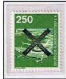
Andreas-Kreuz aus Klischee-Entwertung der Versandstelle.

Die Neueröffnung erfolgte im März 1972 im 1936 gegründeten Frankfurter Flughafen, der inzwischen Drehscheibe des internationalen Flugverkehrs geworden ist.