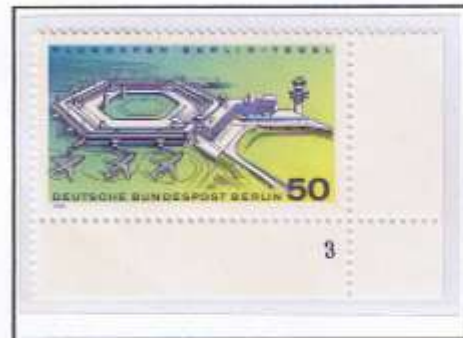
Flughafen Berlin-Tegel im Jahr 1974. Eckrandstücke mit Form-Nr. 2 und 3.

Auf dem Flughafen Berlin-Tegel stand den Kunden das Postamt Berlin 519 (Flughafen Tegel) zur Verfügung. Das Postamt Berlin-Zentralflughafen, war wegen der Verlegung des zivilen Flugverkehrs von Tempelhof nach Tegel mit Ablauf des 31. August 1975 aufgehoben worden.