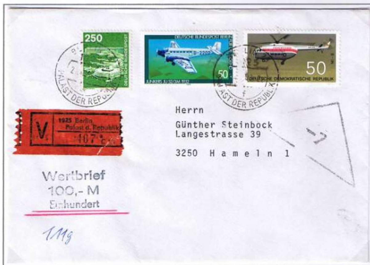
Wertbrief aus Berlin (Ost) mit Schalterabholung. Berlin 25, 23.07.90. DDR-Hubschrauber der Interflug (MI-8) und Berliner JU 52/3M im Anflug auf Flughafen Frankfurt/Main. Brief über 20 g: 1 DM und Wertangabegebühr: 2,50 DM.