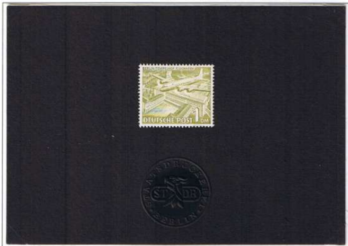
Ankündigungskarton (Senatsvorlage). Schwarzer Karton mit Schutzblatt und Prägesiegel der Staatsdruckerei Berlin mit dem endgültig ver- ausgabten Entwurf des 1-DM-Wertes Berlin Flughafen-Tempelhof. Michel unbekannt.