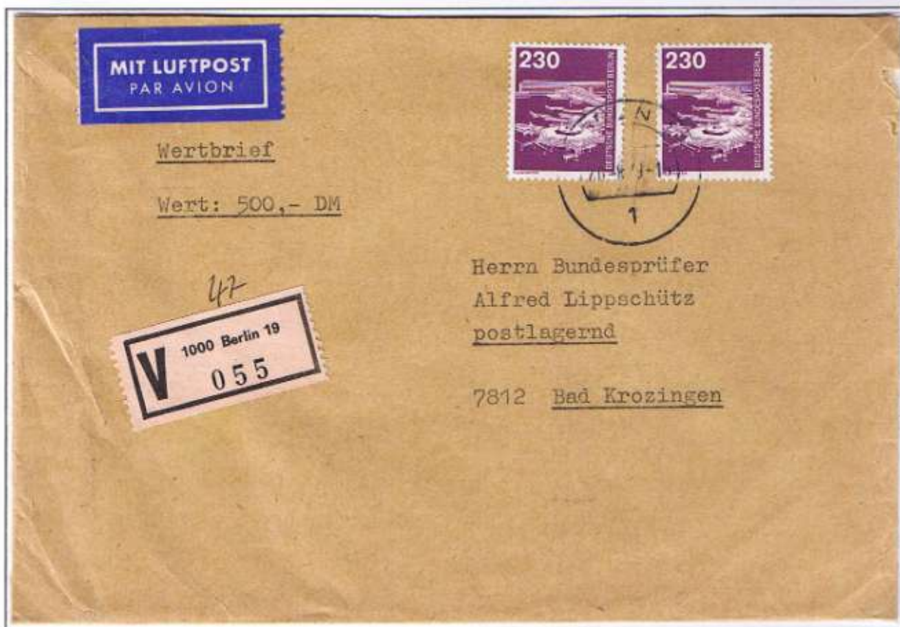
Wertbrief aus Berlin (West) an Postlageranschrift. Berlin 19, 20.08.79. Brief über 20 - 50 g: 1 DM, Luftpostzuschlag 3 x 20 g: 15 Pf und Wertangabegebühr: 3 DM. Ankunft Bad Krozingen, 22.08.79. 45 Pf Überfrankatur.