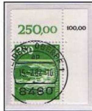
Korrigierter Bogenwertzudruck. Ersttag „Weiden - Oberpf 1, 15.7.82“.

1981 registrierte man fast 18 Millionen Fluggäste, über 630 000 t an Luftfracht und fast 100 000 t Luftpost. Frankfurt bietet in einer Woche nahezu 4 800 Verbindungen mit 190 Städten in 90 Ländern. Für Westberlin war Frankfurt seit der Luftbrücke stets die wichtigste Verbindung und „das Tor zur Welt“.