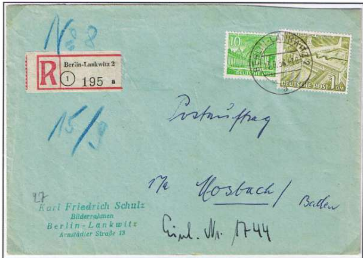
Berlin-Lankwitz 2, 13.9.54. Ankunft Mosbach, 14.9.54. Postauftrag im 3. Tarif (01.07.1954 - 28.02.1963). 1. Gewichtsstufe bis 20 g = 1,10 DM (Brief, Einschreiben, Vorzeigegebühr).