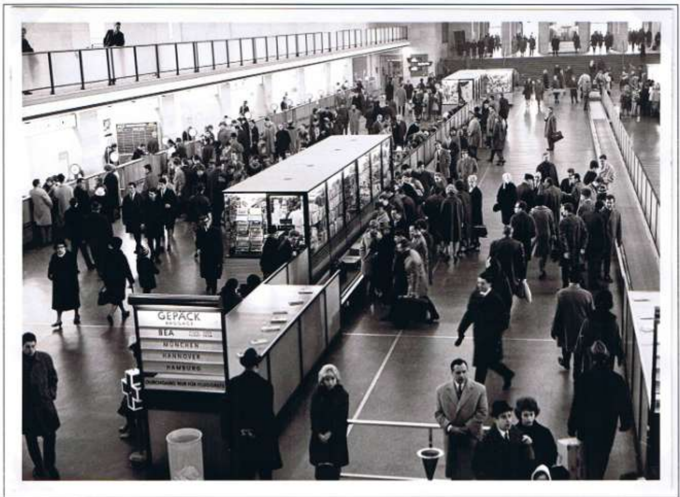
Zentralflughafen, Abfertigungshalle 1964, in der sich auch das Zweigpostamt befand. Unten: Nachtaufnahme des Zentralflughafens 1969. Foto: verschiedene Fluggesellschaften, Busse und Rampen für die Personenbeförderung.