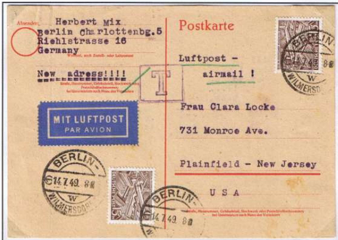
Luftpost-Postkarte aus der Zeit des IAS-Zwanges (2. Tarif: 07.07.1949 - 31.01.1950). Berlin-Wilmersdorf 1, 14.7.49. Freigemacht mit 30 Pf. Richtig: Postkarte 20 Pf, Luftpostzuschlag 60 Pf (2 IAS). T-Stempel ohne Centimen-Angabe gesetzt. Richtig: Fehlbetrag 50 Pf x 4/3 = 67 Centimen. Fehlte diese Angabe, konnten im Empfängerland 150% der dort üblichen Gebühren erhoben werden. Taxe a payer -Stempel mit C-Angaben sind aus Westberlin erst im Tarif ab 01.02.1950 bekannt.