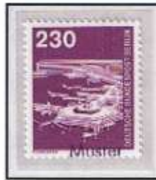
Mustermarke der Ausgabe Westberlins.

Zur 1975 / 1976 eingeführten Postwertzeichen-Dauerreihe Industrie und Technik erschien am 17. Mai 1979 für die Deutsche Bundespost und für die Deutsche Post Berlin ein 230-Pf-Wert.