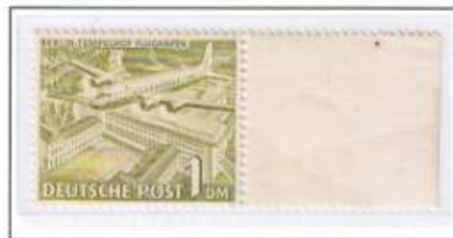
Douglas DC-4, Skymaster, über Flughafen Berlin-Tempelhof.

Später erfolgten Starts und Landungen auch auf den Flughäfen der Briten und Franzosen (Berlin-Gatow und Berlin-Tegel).