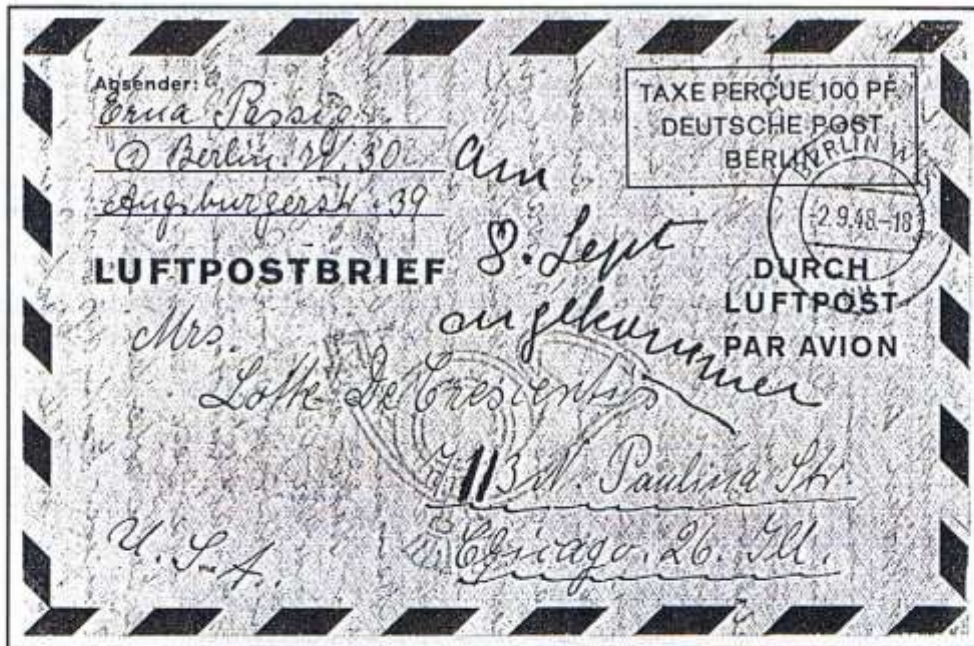
1. Tarif, 26./27.07.1948 - 30.11.1948 (Abgabe an deutsche Postkunden nur gegen 2 IAS). Berlin W 15, 2.9.48. LF 1 I (Erstauflage 10 000 Stück, voll ausgezogene Posthorn-Linien). Durchgang: Frankfurt/Main 2 a, 4.9.48 -12. Ankunft: USA, 8.9.48.