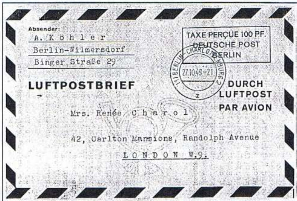
1. Tarif, 26./27.07.1948 - 30.11.1948 (Abgabe an deutsche Postkunden nur gegen 2 IAS). Berlin-Charlottenburg 2, 27.10.48 -21. LF 1 II (dünne parallele Posthorn-Doppellinien).