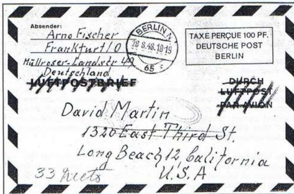
Berlin N 65, 28.8.48. LF 1 II nur als Briefhülle verwendet und auf Luftpostanspruch verzichtet. Mit Einlagen versandt? Absender aus der Sowjetischen Besatzungszone. Keine Durchgangs- oder Ankunftsvermerke.

Mit Einführung des Internationalen Luftpostdienstes zum 1. Dezember 1948, konnten endlich auch deutsche Postbenutzer wieder richtige Briefe bis 100 g versenden. Die IAS-Abgabe für den Luftpostzuschlag wurde aber auch hier beibehalten. Das Interesse an der Versendung von Luftpostfaltbriefen war dadurch nicht mehr so groß und begann zu stagnieren.