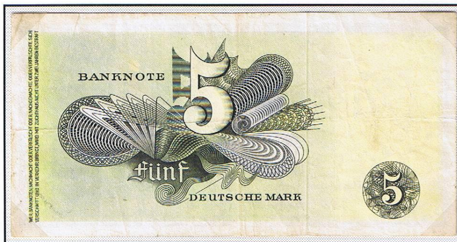
Rückseite des deutschen Nachdruckes. Serienziffer: 9K729378.

Der Nachdruck der 5-DM-Note (Druckvermerk: 9.12.1948) erfolgte von der Urplatte. Englischer und deutscher Druck sind nur aufgrund der Serienziffern zu unterscheiden, die für die Bundesdruckerei 7A bis 13G lauten.