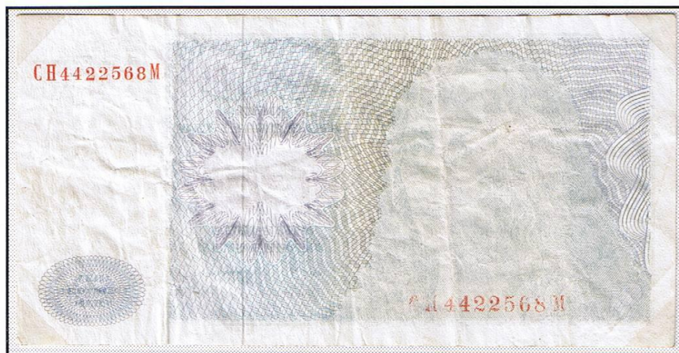
10 Deutsche Mark der „Deutschen Bundesbank“. Vorderseitig ohne vollen Druck oder „Sammlerbearbeitung“? Bei Aussortierung derartiger Noten erfolgt Ersatznoten-Hinzufügung.

Ersatzscheine unterbrechen die laufende Numerierung auf den Scheinen und unterscheiden sich durch eine Kennung vor der Numerierung (Kreuz, Stern, oben: Buchstabe „Y“).