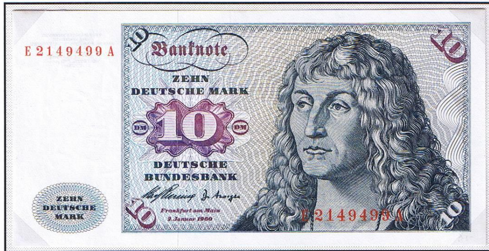
10 Deutsche Mark der „Deutschen Bundesbank“ vom 2. Januar 1960 ( Erstausgabe ).

Nachfolgerin der „Bank Deutscher Länder“ wurde durch Gesetz vom 27. Juli 1957 die „Deutsche Bundesbank“, die das ausschließliche Recht zur Ausgabe von Banknoten in der Bundesrepublik Deutschland und Westberlin erhielt.