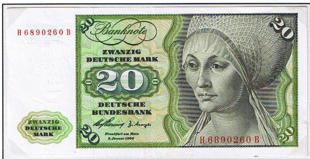
20 Deutsche Mark der „Deutschen Bundesbank“, die erste Note dieser neuen Serie (Erstausgabe 2. Januar 1960). Rückseitig noch mit Strafzusatz „Zuchthaus“, später mit „Freiheitsstrafe“.

Zunächst wurden die Noten der „Bank Deutscher Länder“ weiter ausgegeben, doch sofort mit der Vorbereitung zum Druck neuer Noten begonnen, die in der Zeit vom 10. Februar 1961 (erste Note zu 20 DM) bis zum Frühjahr 1965 (letzte Note zu 500 DM) ausgegeben wurden (ungültig zum 1. Juli 1995).