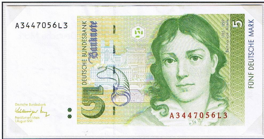
5 Deutsche Mark der „Deutschen Bundesbank“ ( 1. August 1991 ). Nach dem 10-, 50-, 100- und 200-DM-Schein, folgte erstmals die 5-DM-Note dieser neuen Serie.

Zwei Tage nach Öffnung des „Brandenburger Tores“ entfielen ab 24. Dezember 1989 auch Zwangsumtausch und Visazwang. Der Wechselkurs betrug, ähnlich der 2. Währungsreform am 21. März 1949, durchschnittlich 1 : 6.