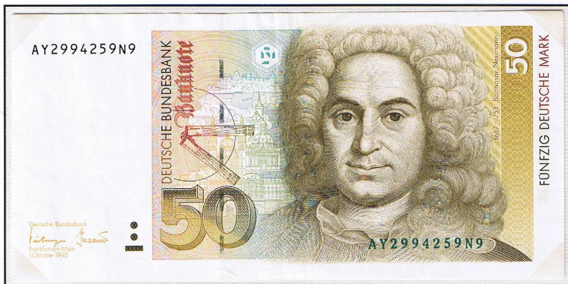
50 Deutsche Mark der „Deutschen Bundesbank“, erstmals verausgabt zum 2. Januar 1989 (hier: 1. Oktober 1993).

Neben den bereits genannten Noten, wurden zum 1. August 1991 noch der 20- und 500- und 1000-DM-Schein in Umlauf gegeben.