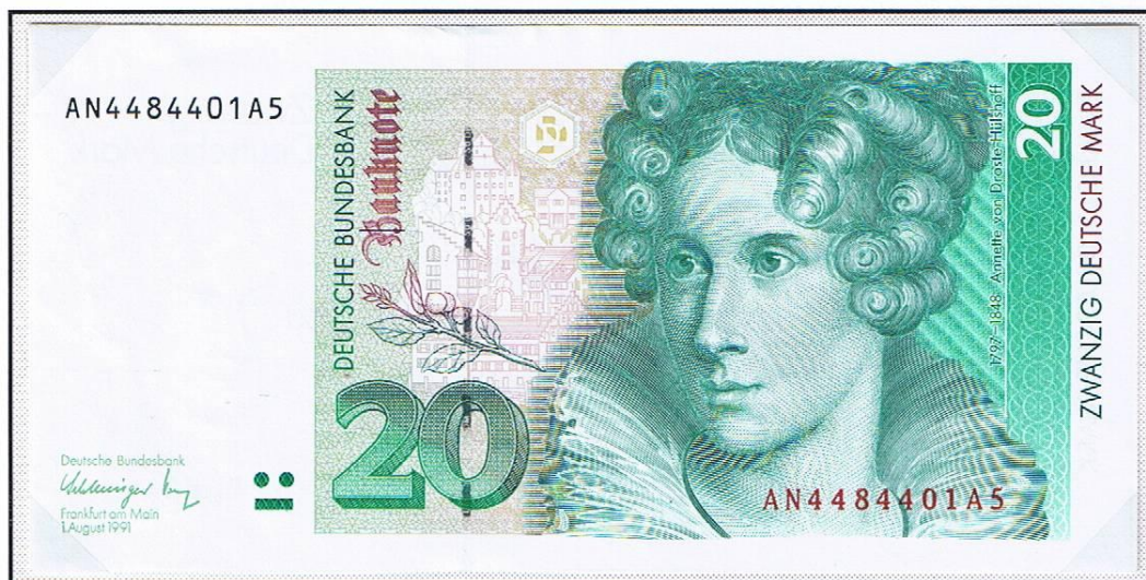
20 Deutsche Mark, Frankfurt am Main, 1. August 1991. Die Noten der Staatsbank der DDR gehörten der Vergangenheit an.

Mit der Währungsunion zum 1. Juli 1990 wurden DDR-Postwertzeichen gegen Westmark verkauft. Sie waren im gesamten Ursprungsgebiet und in Westberlin sowie der Bundesrepublik gültig. Der Geldumtausch Westmark gegen Ostmark begann.