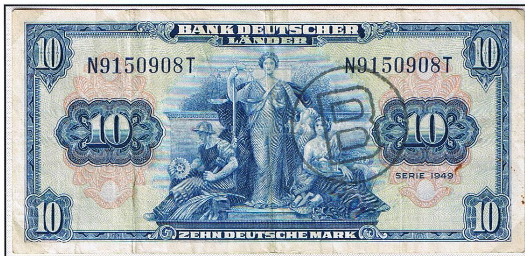
10 Deutsche Mark (Serie 1949 / 22. August 1949). Abbildung: Mitte allegorische Gruppe (ein Mann und zwei Frauen, die das Handwerk verkörpern). Auflage: Höhe unbekannt. Im Umlauf seit 13. Dezember 1951. Außer Kurs: 1. August 1966. Ungültig: 1. Januar 1957.

Nach den beiden Kleingeldscheinen über 5 und 10 Pf für fehlende Scheidemünzen verausgabte die „Bank Deutscher Länder“ am 13. Dezember 1951 und 27. November 1952 ihre ersten „richtigen“ Banknoten. Es waren dies die Nachausgaben zur 1948er Serie der A.B.C. (American Bank Note Co.) zu 10 und 20 Mark, die jetzt den Namen der Bank trugen (Oberrand) anstatt das Wort „Banknote“ und den Eindruck „Serie 1949“.