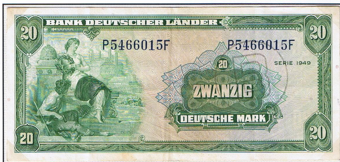
20 Deutsche Mark (Serie 1949 / 22. August 1949). Abbildung: Allegorie (Mann und Frau). Auflage: Höhe unbekannt. Im Umlauf seit 27. November 1952. Außer Kurs: 1. Februar 1964. Ungültig: 1. Mai 1964.

Im Gegensatz zu den Erstausgaben (Serie 1948) sind die Kontroll-Nr. jetzt blau anstatt rot. Beide Scheine sind ohne Wasserzeichen gedruckt, aber mit einem winzigen Druckerzeichen „ABNCo“, in den Abbildungen versteckt, als Hinweis auf die amerikanische Notendruck-Firma versehen.