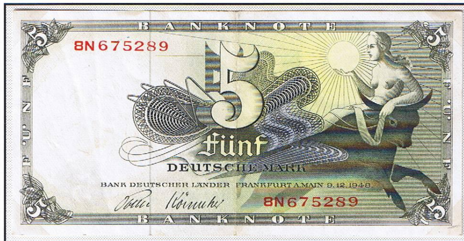
5 Deutsche Mark (Druckdatum: 9.12.1948). Nachdruck der Bundesdruckerei. Abbildung: „Entführung der Europa“. Keine B-Kennzeichnung. Sicherheitsfaden und Wasserzeichen „Frauenkopf“. Auflagen ? Außer Kurs: 1. August 1966. Ungültig: 1. Januar 1967.

1956 folgte noch vor dem Erlaß des Bundesbankgesetzes vom 26. Juli 1957 der Nachdruck des britischen 5-DM-Scheines (Europa auf dem Stier) durch die Bundesdruckerei (Druckauftrag von 1955).