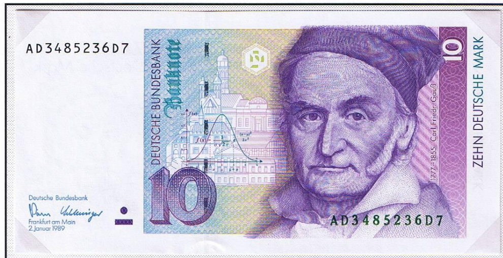
10 Deutsche Mark der „Deutschen Bundesbank“. Erstausgabe-Datum vom 2. Januar 1989. Ab 1990 auch Zahlungsmittel in der DDR.

Ab 1990 verausgabte die „Deutsche Bundesbank“ eine neue Notenserie, die den neuen Fälschungstechniken standhalten sollte. Was 1948 in der Sowjetischen Besatzungszone begann, Banknoten und Postwertzeichen der SBZ erhielten in Gesamt-Berlin Gültigkeit, wiederholte sich durch den Nachfolger DDR nun hinsichtlich der Postwertzeichen. Die Noten der „Deutschen Bundesbank“ und die Postwertzeichen der Bundesrepublik und Westberlins erhielten in Ostberlin und in der DDR Gültigkeit.