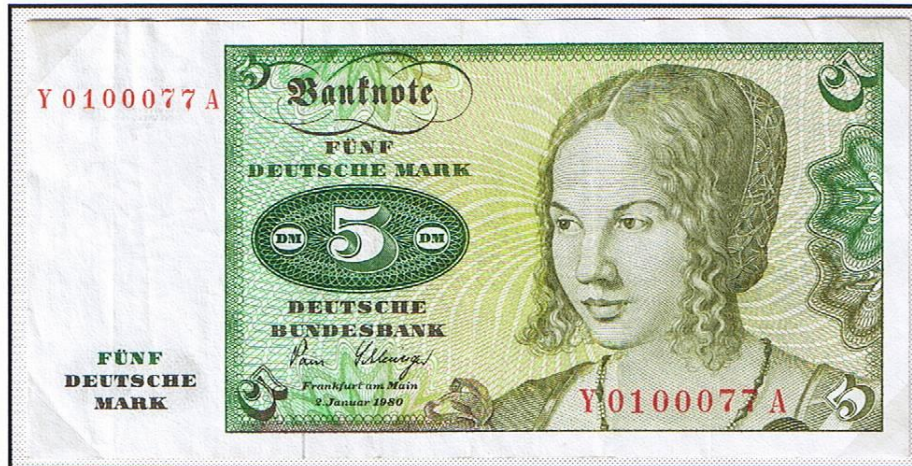
5 Deutsche Mark der „Deutschen Bundesbank“, rückseitig jetzt mit Unterschrift „Pöhl-Schlesinger“. Normalnoten tragen vor der KN die Buchstaben „B“ und „R“. Ersatznoten die Kennziffer „Y“.

Ersatznoten werden auch „nachgeschobene Noten“ genannt. Bei Kontrollen der Herstellerfirmen von Geldscheinen werden sogenannte Makulaturen (schlecht oder unvollständig gedruckte, verdruckte, verschnittene oder sonst zu beanstandende Noten) aussortiert und durch einwandfreie Noten ersetzt, damit die Anzahl der gezählten Scheine wieder stimmt oder auch die Zählung nach der auf den Scheinen gedruckten Numerierung (Kontrollziffer) weiter möglich ist.