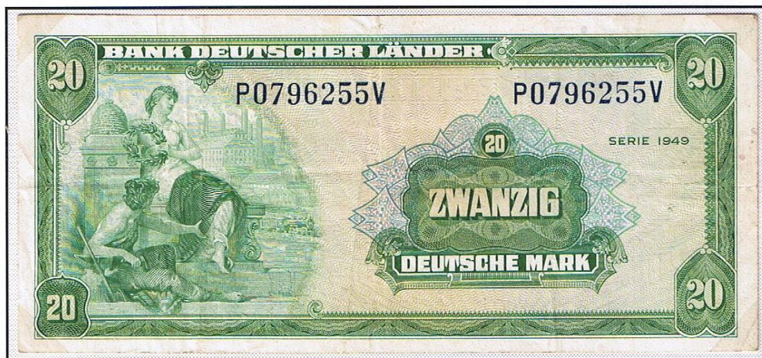
20 Deutsche Mark (Serie 1949), Ausgabe für Westdeutschland. Nachauflage der „Bank deutscher Länder“ (22. August 1949).

Die „Poschta“, oder 15 Sätze „Rotaufdruck BERLIN“, stellten auch in Naturalien den Gegenwert von 5 Pfund Schmalz dar. 2 Westmark bedeuteten 100g Bienenhonig, auch ca. ½ US-Dollar.