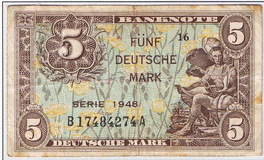
5 Deutsche Mark (Serie 1948), Ausgabe für Westdeutschland. Diese Note hatte von den „kleinen Scheinen“ die höchste Startauflage.

Anfang 1949 kostete die berühmte „Poschta“ 100 Westmark oder 400 Ostmark. Mitte 1949 verschob sich das Kursverhältnis auf 1 : 6. Für 100 Westmark waren auch 15 Sätze „Rotaufdruck BERLIN“ zu bekommen (März 1949). Auch der Versand von 80 Luftbrücken-Paketen wurde möglich.