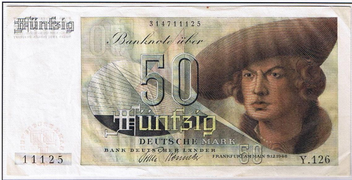
50 Deutsche Mark (9.12.1948) mit 3stelliger Serien-Nr. Ausgabe für Westdeutschland. Typisches, sehr dünnes Ramiefaserpapier mit genarbter Oberfläche der „Banque de France“.