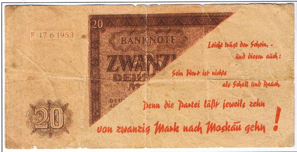
Leicht trägt der Schein, und dieser auch: Sein Wert ist nichts als Schall und Rauch. Denn die Partei lässt jeweils zehn von zwanzig Mark nach Moskau gehn!