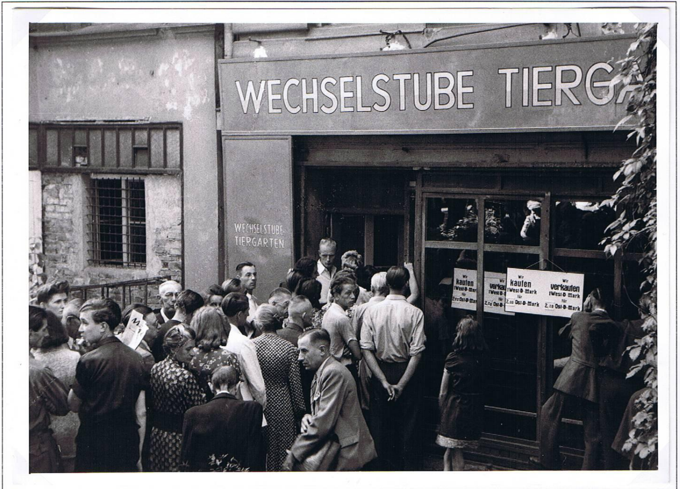
Offiziell eingerichtete Wechselstube der Berliner Finanzverwaltung im Tiergarten, Bezirk Tiergarten, Flensburger Straße. Aufnahme: Juli 1948. Schilder: „Wir kaufen 1 West-D-Mark für 2 Ost-D-Mark“ und „Wir verkaufen 1 West-D-Mark für 2,20 Ost-D-Mark“.