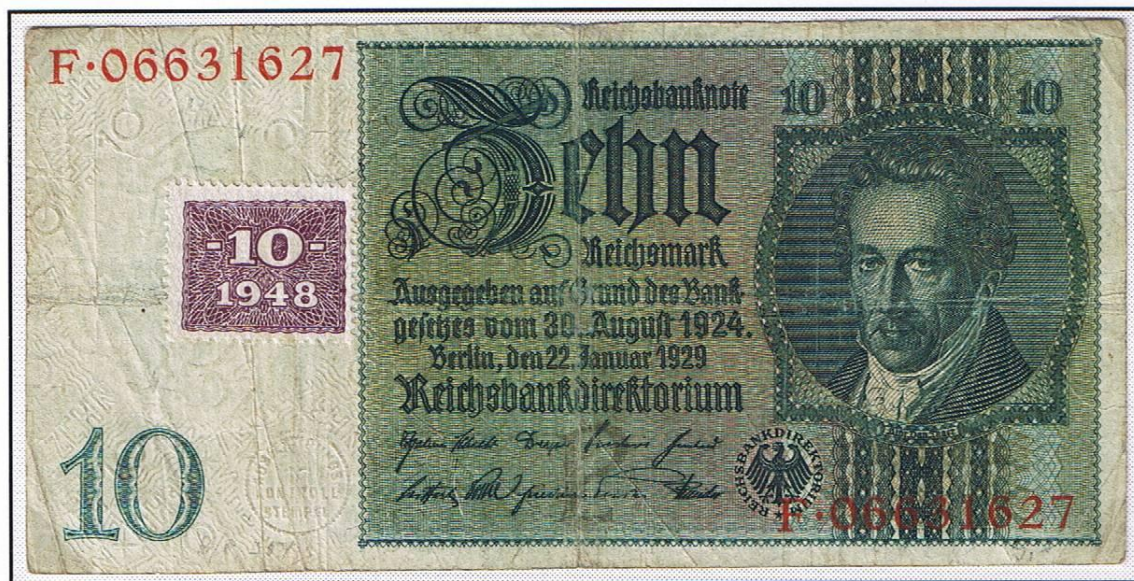
10 Reichsmark vom 22.1.1929 mit aufgeklebtem Kupon gleichen Wertes. In den 70er bis 80er-Jahren kamen über die DDR auch Restbestände des Kupon-Aufklebers in den Handel. Bankfrische Scheine mit Kupon sind häufig nachträglich aufgeklebt, um einen höheren Marktwert zu erzielen.

Die Kupon- oder Klebmark hatte in Berlin nur rund einen Monat Gültigkeit (bis 28. Juli 1948). Sie wurde dann von den neugedruckten Banknoten der ostzonalen „Deutschen Notenbank“ abgelöst.