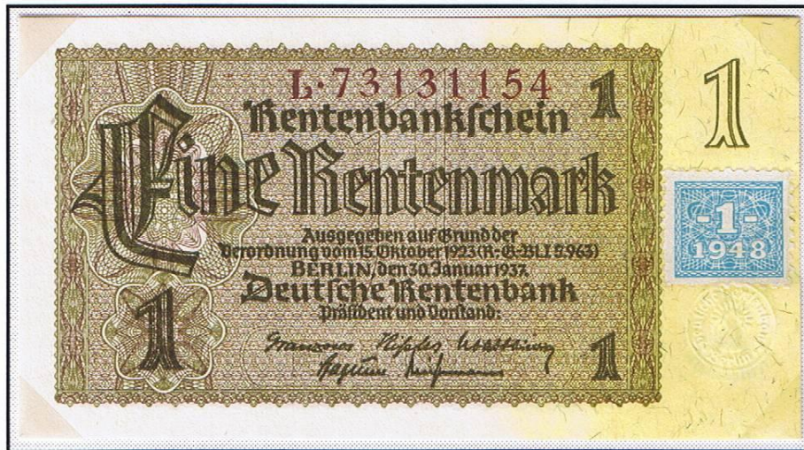
1 Rentenmark vom 30.11.1937 (ausgegeben am 5.9.1939), mit Kupon in gleicher Wertstufe als Ostmark ab 24. Juni 1948 in Umlauf. Ohne Kupon ab 25. Juni 1948 bis 28. Juli 1948 in Westberlin als 10 Pf-Kleingeldersatz gültig.

In Groß-Berlin wurden 200 Mio. Kuponmark ausgegeben (SBZ 1,8 Mrd.). Den Banken stand ein Bargeldbestand von zusätzlich 1.615 Mrd. zur Verfügung. Ferner eine Emissions-Reserve von 500 Mio. Ostmark. Später, beim Geldumtausch in Scheine der „Deutschen Notenbank“, wurden von den ausgegebenen Kuponmark 11. Mio. nicht wieder eingetauscht.