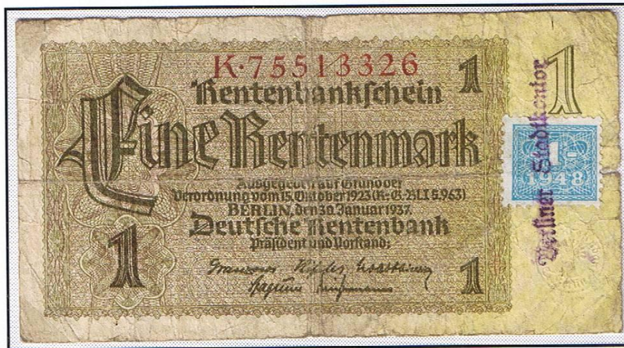
1 Rentenmark mit Kupon-Aufkleber (Ostmark) . Gummistempel „Berliner Stadtkontor“ über den Kupon. Das „Berliner Stadtkontor“ hatte für Berlin die Aufgabe, die für die SBZ die „Deutsche Emissions- und Girobanken“ übernommen hatten (Umtausch alter Geldscheine, Konten-/Einlagen-Umwertung).

An 80 Stellen gelagert, für 43 Millionen Stück Banknoten vorgesehen, warteten sie darauf, auf die marode Reichswährung verklebt zu werden. Auch die 2,5 Millionen Westberliner sollten damit versorgt werden.