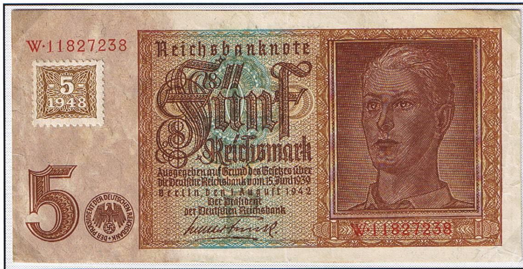
5 Reichsmark vom 1.8.1942 mit aufgeklebtem Kupon gleichen Wertes. Im Juli 1948 betrug der Wechselkurs West-/Ostmark 1 : 3 (Mittelwert).

Mit Kuponmark der Sowjetischen Besatzungszone konnten sowohl Postwertzeichen der SBZ, wie auch solche Westberlins gekauft werden (Posthörnchen Band- und Netzaufdrucke bzw. Bezirkshandstempel-Aufdrucke).