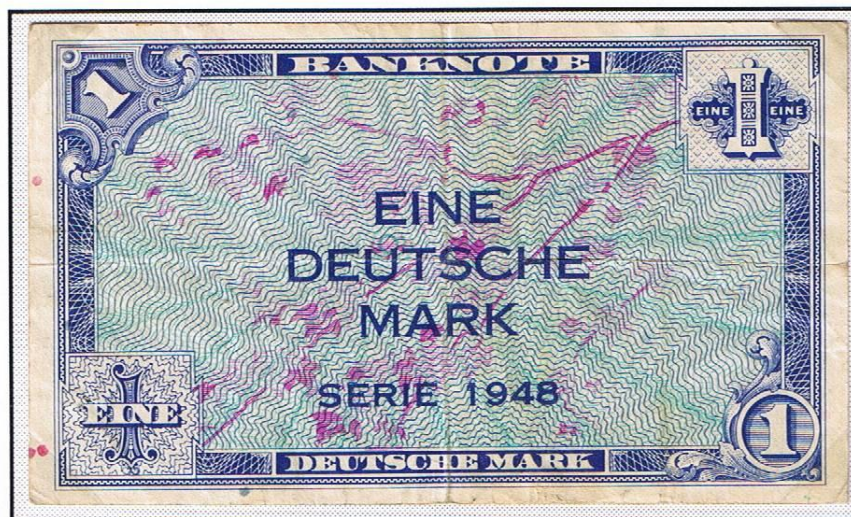
1 Deutsche Mark (Serie 1948), in den USA gedruckt, numeriert und geschnitten und im Februar 1948 auf dem Luftwege zur Vorbereitung einer Währungsreform nach Frankfurt/Main gebracht.

Berlinreisende brachten die Banknoten Westdeutschlands nach Westberlin und in den Umlauf und nahmen B-gekennzeichnete Scheine mit in die Trizone. Westberliner durften anfangs nur bis 300 Westmark bei Reisen nach Westdeutschland ausführen.