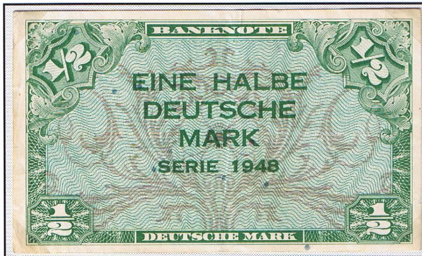
½ Deutsche Mark (Serie 1948), wie sie bereits ab 20. Juni 1948 in Westdeutschland anlässlich der dortigen Währungsreform in den Verkehr gegeben wurde.

Neben den B-gekennzeichneten Westmark-Noten, die aus statistischen Gründen für Westberlin markiert wurden (z. B. für einen sofortigen Notenaustausch), waren in den Westsektoren Berlins auch sofort die in Westdeutschland ohne besondere Kennzeichnung ausgegebenen Banknoten gültig.