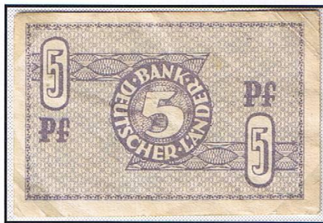
Rückseite des 5-Pf-Scheines.

Als Kleingeld-Ersatz kamen zum 20. August 1948 die neuen Kleingeldscheine zu 5 und 10 Pf der „Bank Deutscher Länder“ in den Umlauf. Sie lösten die ungültig gewordenen Provisorien ab, in der französischen Zone Westdeutschlands die dort gültigen 5, 10 und 50 Pf-Noten. Die neuen Kleingeldscheine behielten in den Berliner Westsektoren bis zum 31. Oktober 1950 Umlauffähigkeit und wurden dann durch neue Kleinmünzen ersetzt.