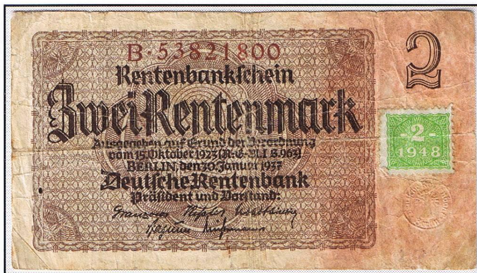
2 Rentenmark vom 30.11.1937 (ausgegeben am 5.9.1939) mit Kupon gleicher Wertstufe. In den Westsektoren Berlins voll gültiges Zahlungsmittel.

Die im Buchdruck hergestellten Kupons gibt es auf Rentenmark- und Reichsmark-Scheinen (Rentenmark zu 1, 2, und 5 Mark mit acht Varianten. Reichsmark zu 5, 10, 20, 50 und 100 Mark mit 17 Varianten). Scheine über 1000 Mark wurden nicht mit Kupons versehen. 50-Mark-Kupons auf 20 Mark-Scheinen usw. sind bekannt.