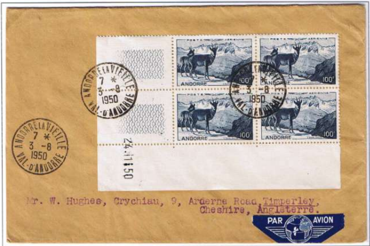
Andorre la Vieille, 3.8.50. Tarif: 01.12.48 - 30.04.51. Brief bis 20 g 25 F / 15 F. Luftposttarif (Europa): 03.02.50 - 09.05.58, je 20 g 8 F. Überfrankiert. Vierereckrandstück mit Druckdatum 24.1.50.