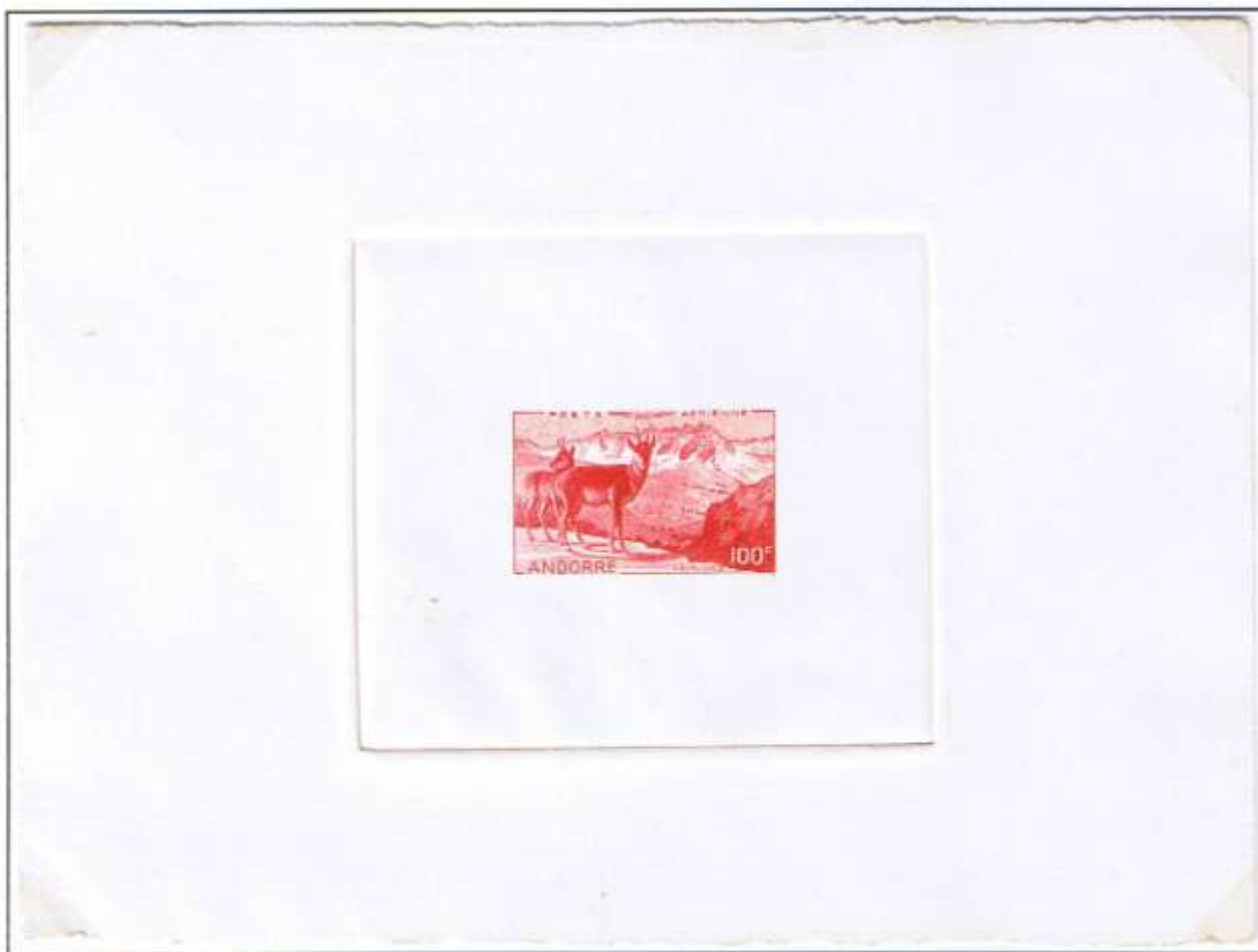
Künstlerprobedruck des Graveurs vom Originalstock in der Farbe Rot.

Bis 1955 stellte der Graveur Probedrucke nach Belieben her. Mehr als etwa 24 Stück waren jedoch technisch nicht möglich, da spätestens dann der Einzelstock abgenutzt war. Etwa 5 Exemplare verblieben bei der Post bzw. dem Postmuseum, der Rest beim Künstler, der sie mit oder ohne Signatur verkaufen konnte. Die Kartons tragen keinen Siegeleindruck.