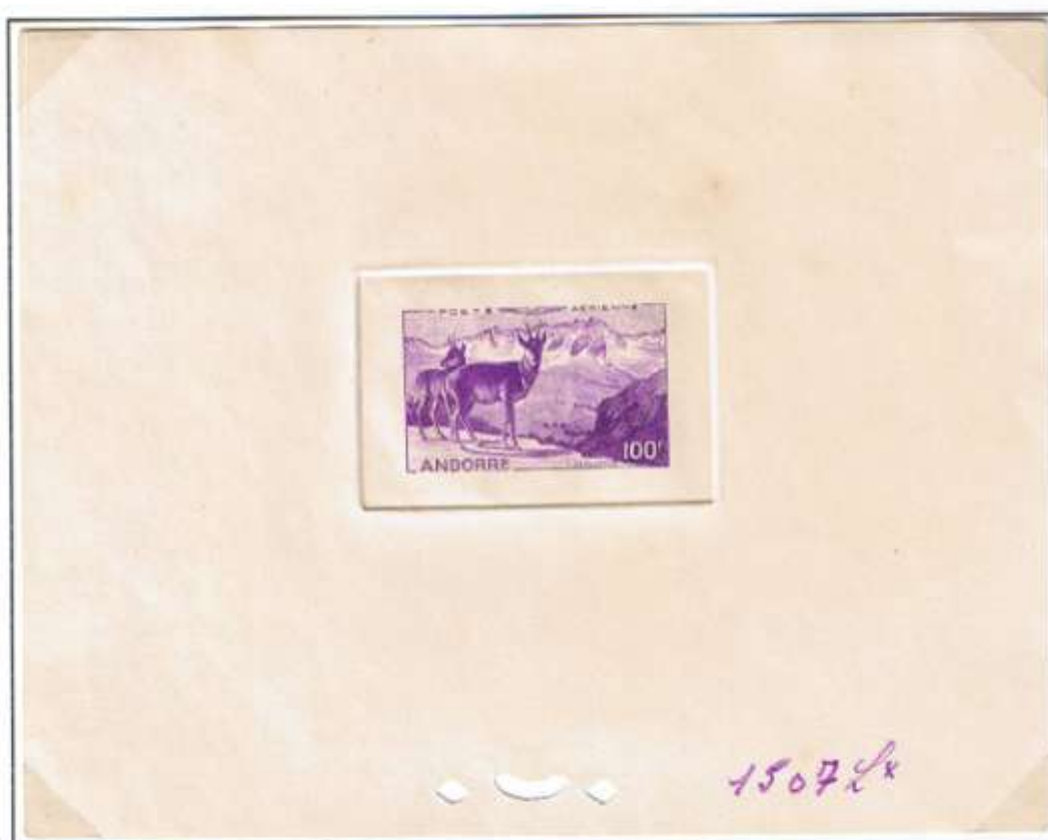
Farbprobedruck der Französischen Staatsdruckerei vom gehärteten Einzelstock in der Farbe Violett. Auflage etwa 20 Exemplare. Rechts unten: Farbton-Nr.

Die Farbprobedrucke zeigen meist rechts unten einen handschriftlichen Druckereivermerk, z. B. 1507* = Nr. des verwendeten Farbtons. Bevorzugt wurde auch hier die Form der Gravur (altes Verfahren). Diese Farbprobedrucke sind ein wesentlicher Bestandteil des Druckvorganges. Von der 100-F-Flugpostmarke wurden in 4 verschiedenen Farben, jeweils zirka 20 Exemplare gedruckt, farbabweichend vom Künstler-Handpresseabzug. Die Farbe Sepia durfte nicht verwendet werden. Sie war nur den Kontrollprobedrucken des Markendesigns vorbehalten.