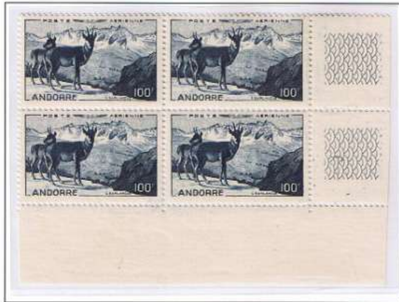
Pyrenäenlandschaft (Felsregion) in französisch Andorra mit Gemsen