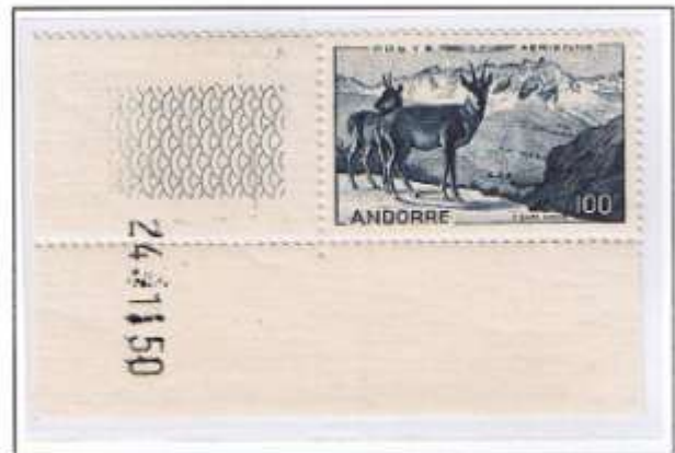
Druckdatum 24.1.50 im Eckrandstück.

Stichtiefdruck: Nach dem Härten der Platte, wird das vertieft liegende Markenbild auf ein Stück Rundstahl übertragen. Dabei wird das Markenbild reliefartig geprägt.