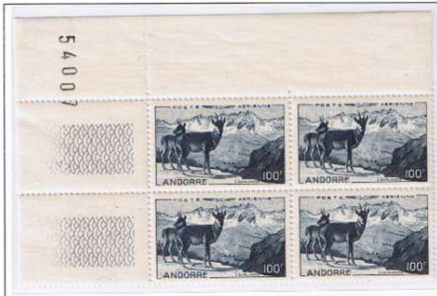
Viereckrandstück mit Bogenzähler-Nummer „54007“. Gedruckt wurden die Marken von 1.350.151 bis 1.350.175.

Von der gehärteten Molette erfolgt die Übertragung auf den mit einer weichen Kupferschicht überzogenen Druckzylinder, der durch Verchromung gehärtet wird. Das Bild erscheint auf dem Druckzylinder vertieft und seitenverkehrt.