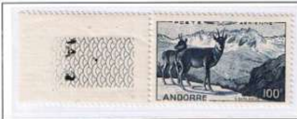
Randstück mit Drucker-Nr. 1 A 2.

Der Entwurf und Stich Barlangues zeigt eine Pyrenäenlandschaft mit Gemsen ( Rupicapra rupicapra Bovidae ) und wurde im Stichtiefdruck vorgenommen. Gedruckt wurde am 24.1.50, das Ausgabedatum auf den 10.2.50 festgelegt.