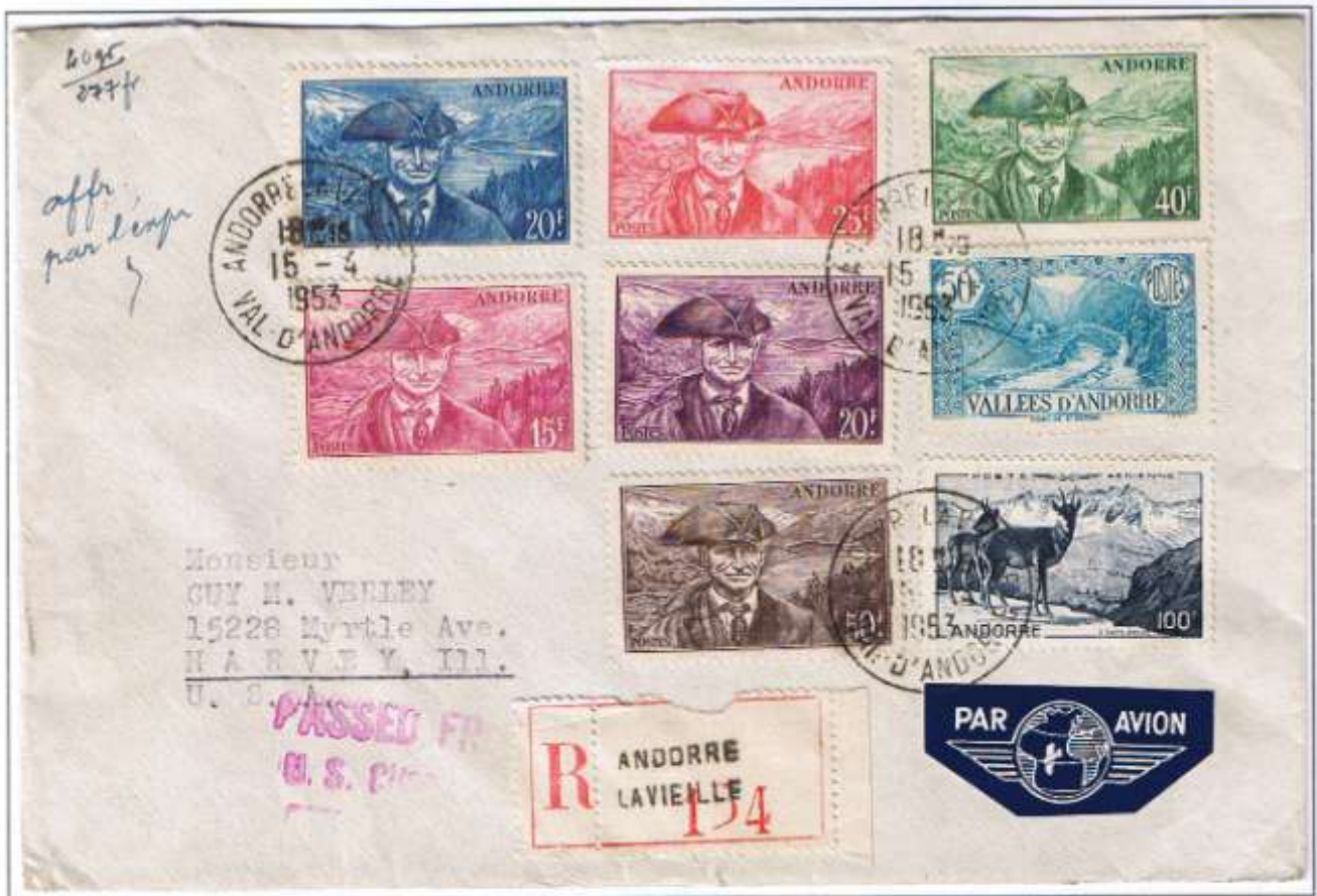
Andorre la Vieille, 15.4.53. Brief bis 40 g: 30 F + 18 F. Einschreiben: 45 F, Luftpost: 8 x 5 g je 23 F = 184 F. Gesamtgebühr: 277 F. Überfrankatur: 43 F. USA-Zollstempel: Passed Free ... Ankunft Harvey: 21.4.53.