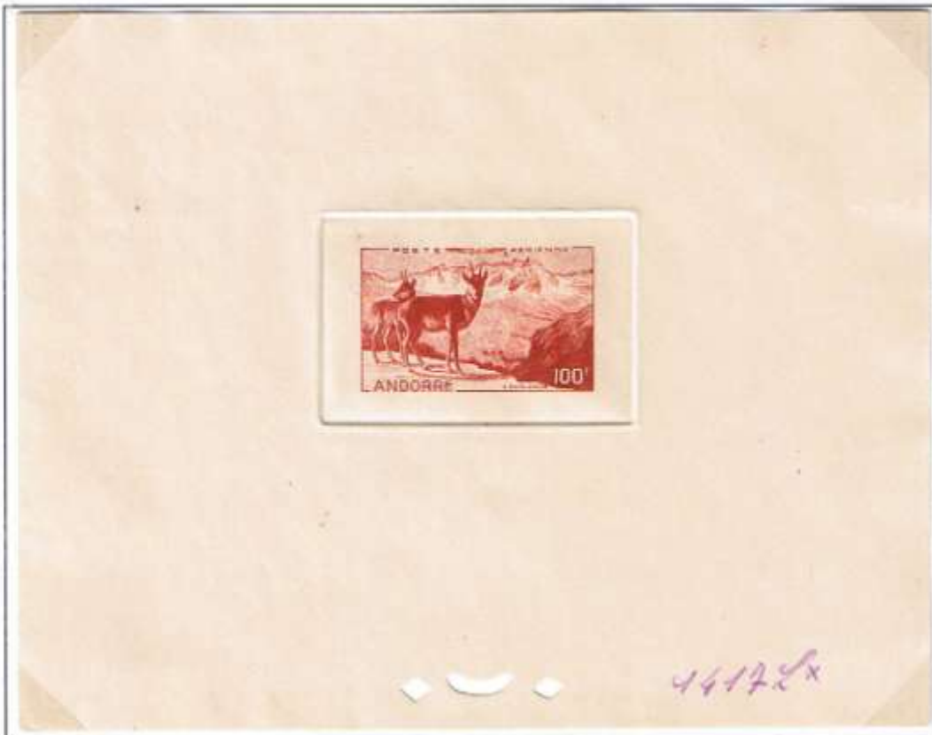
Farbprobedruck der Französischen Staatsdruckerei auf Ministerblockkarton. Farbe: Braunrot. Handschriftliche Farb-Nr.: 1417L*.