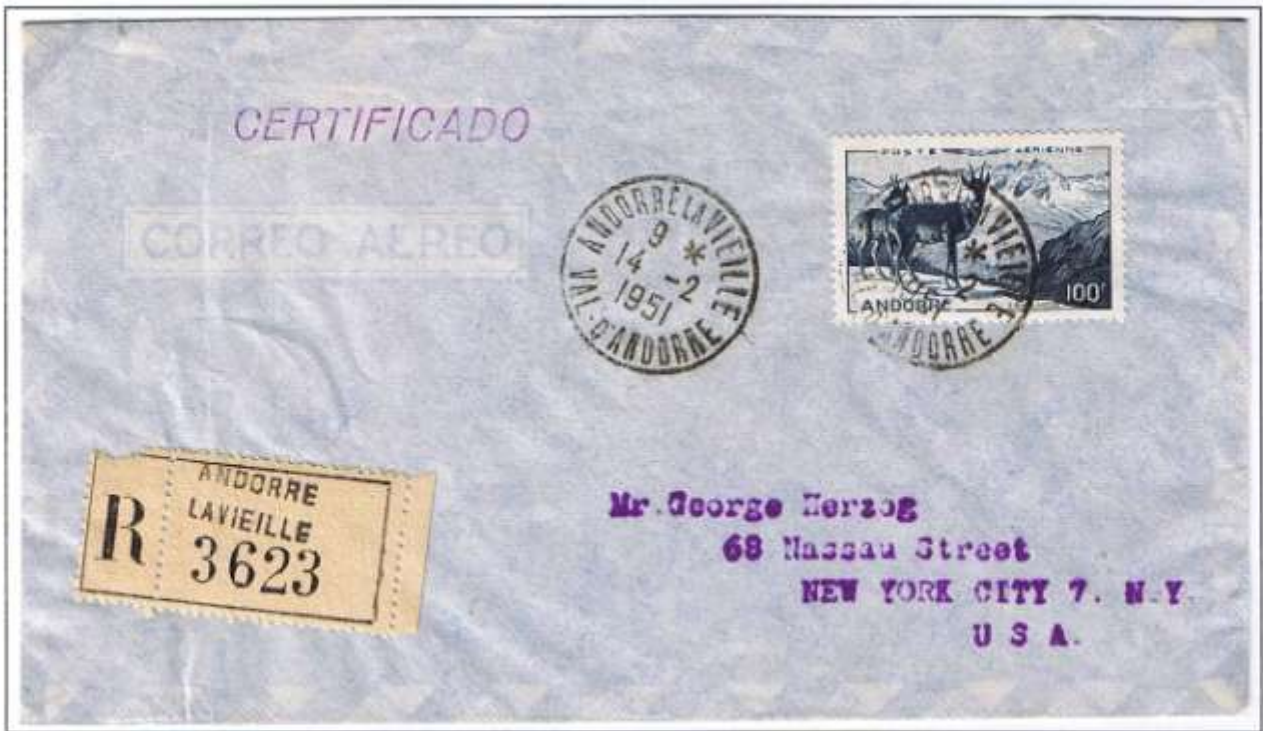
Andorre la Vieille, 14.2.51. Tarif: 01.12.48 - 30.04.51. Brief bis 20 g 25 F, Luftposttarif (USA): 15.05.50 - 09.05.58, je 5 g 23 F und Einschreiben 50 F. Gesamt: 98 F. Ankunstempel New York, N.Y., 18.2.51 (schwarz) und 19. Feb 1951 (lila).