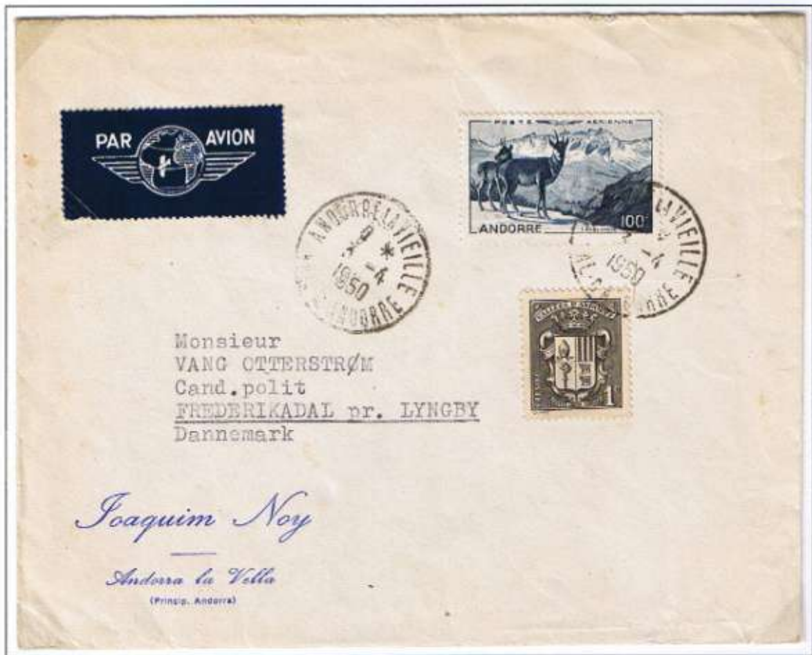
Andorre la Vieille, 3.4.50. Tarif: 01.12.48 - 30.04.51. Brief bis 20 g 25 F, je weitere 20 g 15 F. Luftposttarif Europa: 3.2.50 - 09.05.58, je 20 g 8 F. Überfrankiert.