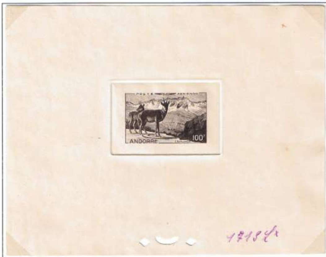
Farbprobedruck der Französischen Staatsdruckerei auf Ministerblockkarton mit Kontrollperforation. Farbe: Schwarz. Handschriftliche Farb-Nr.: 1718L*.